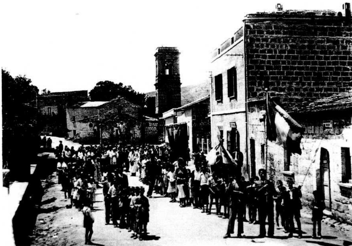
Chiesa di Vaglie prebellica

e donne del paese. Essa è scomparsa verso gli anni '60 del dopoguerra.